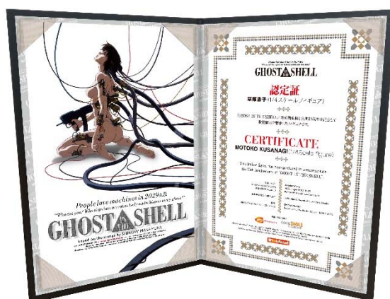
GHOST IN THE SHELL/攻殻機動隊 草薙素子 認定証（右）